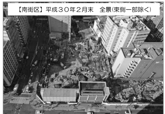
【南街区】平成30年2月末 全景(東側一部除く)

西街区：11階床のコンクリート工事完了 内装及び仕上げユニット工事中 **9月末竣工予定**