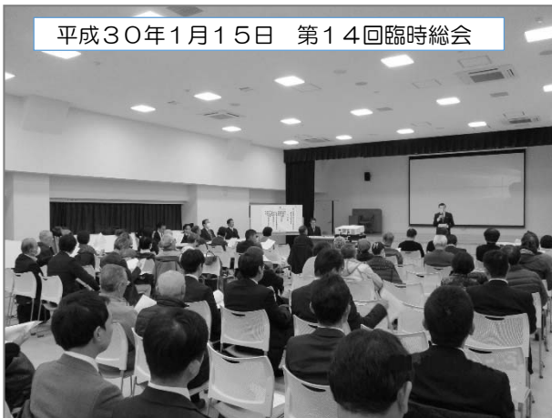
平成30年1月15日 第14回臨時総会

平成30年1月15日(月)19時より文京区民センターにて、第14回臨時総会が、組合員40名を超える出席のもと開催されました。今回の議決事項「権利変換計画変更認可申請について」は、議案の通り可決されました。