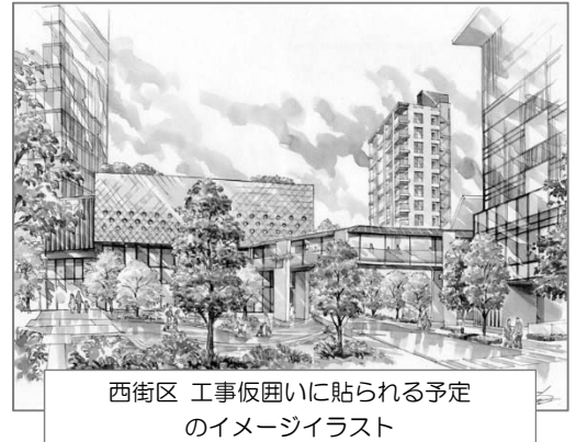
西街区 工事仮囲いに貼られる予定のイメージイラスト

この度、権利者の皆様方のご意見を反映させた正式な名称にすべく、理事会での検討で絞り込んだ4つの候補案の中から一つを選んでいただくためのアンケート調査を実施いたします。